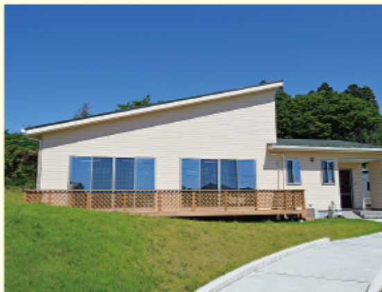
子育て支援室外観／満3歳児保育・未就園児親子教室